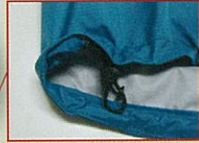
裾ドロコード調整機能付