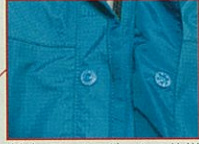
前立てレインガーター仕様